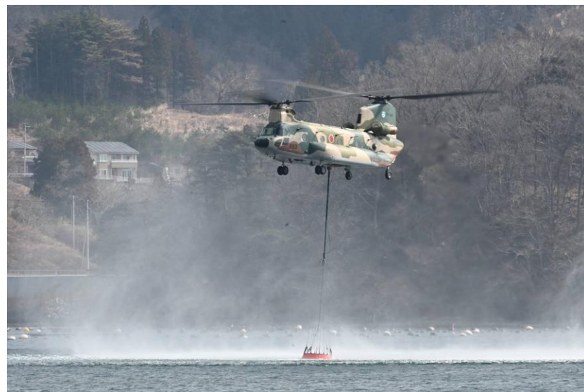
自衛隊大型ヘリによる海水取水