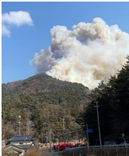
火災発生直後の赤崎町字合足地内