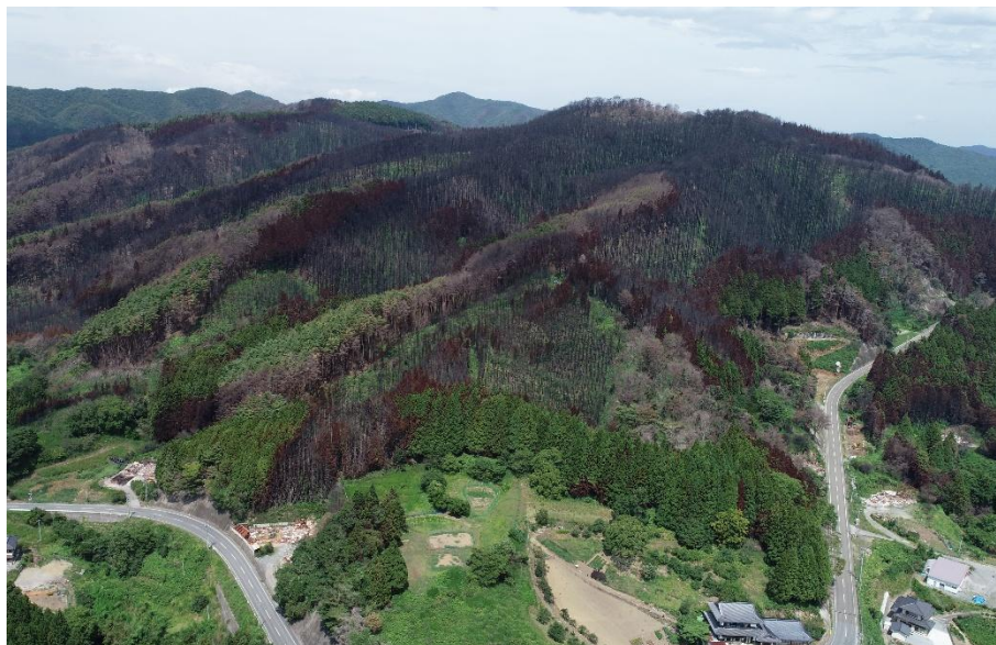
森林の被害状況（三陸町綾里小路地域）