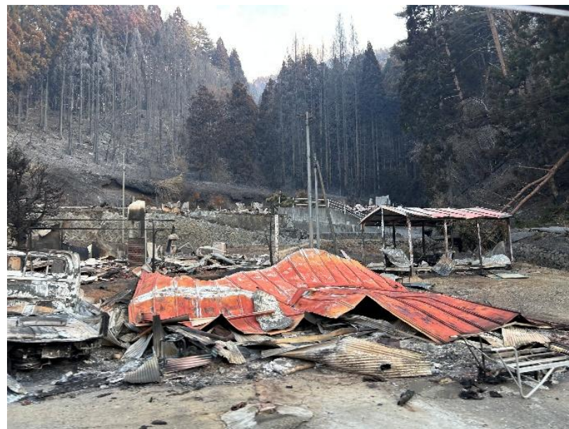
火災の被害を受けた家屋