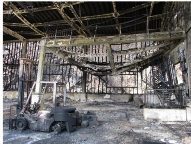
作業保管施設(定置漁業用倉庫)内部