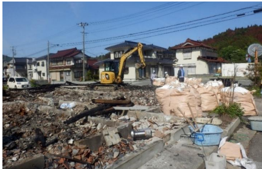
被災家屋等の公費解体