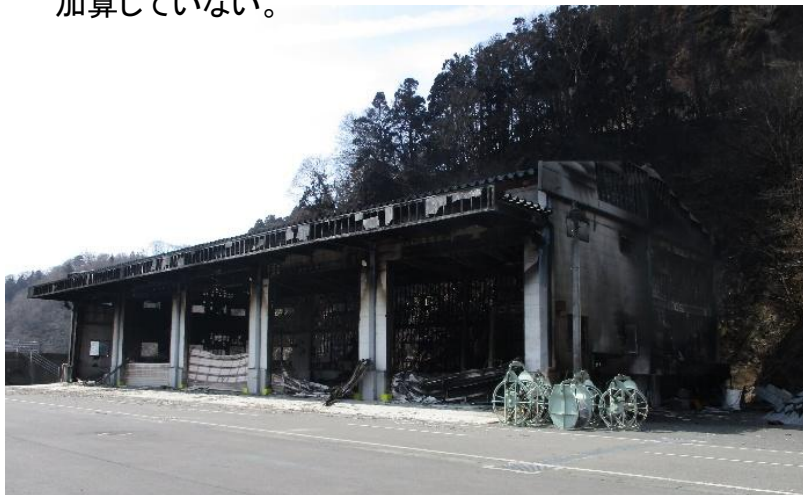
作業保管施設(定置漁業用倉庫)

※（）内の金額は、商工・観光業関係に係る「事業用設備（給水管、冷凍庫、給湯器等）」の額に含まれるため、被害額合計には加算していない。