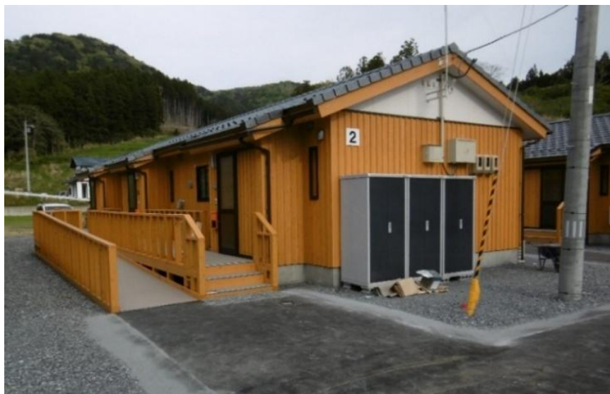
建設型応急仮設住宅(蛸ノ浦地区)