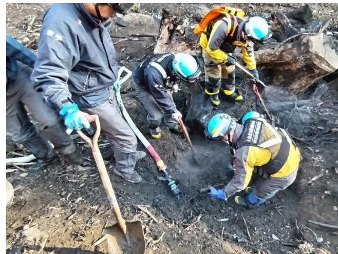
大船渡地区消防組合、市消防団、県内相互応援隊による現地の総合的調査