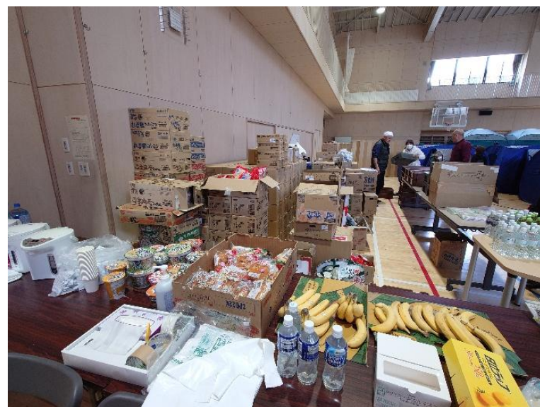
越喜来小学校体育館に設置した避難所