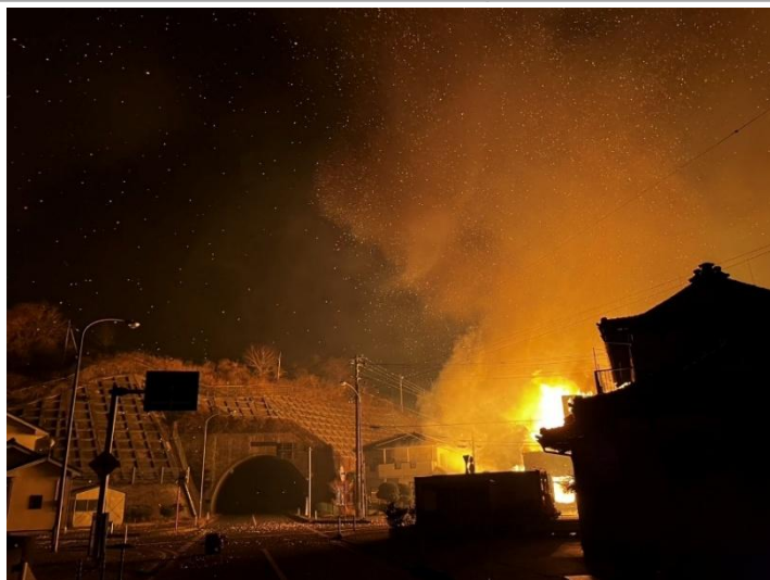
三陸町綾里字港地内 火の手が住宅にまで及ぶ