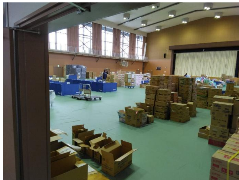
各所から寄せられた支援物資