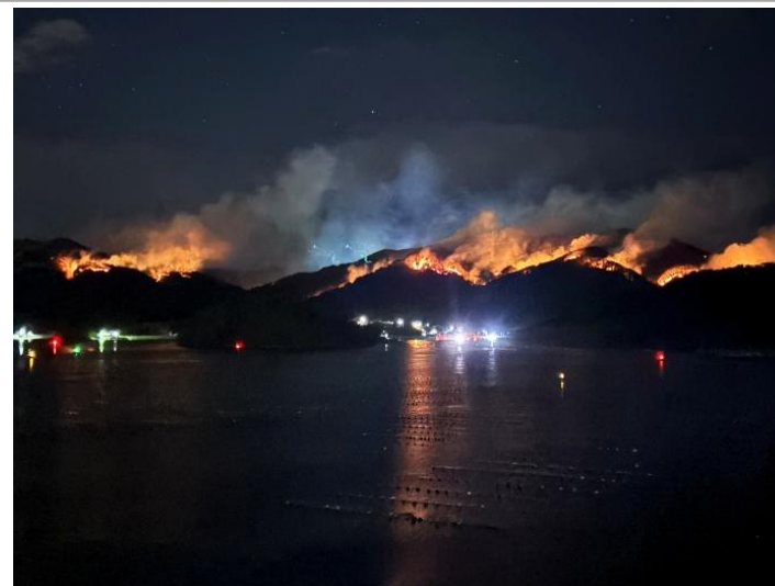
大船渡町から赤崎町方面を望む