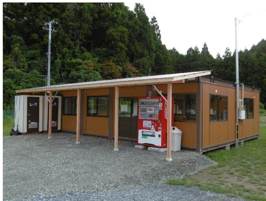
支援団体による応急仮設住宅談話室の設置