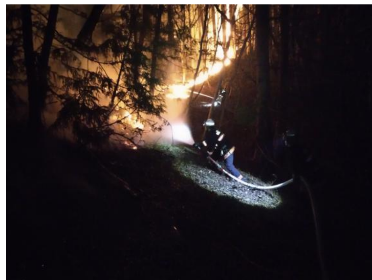
消防隊員による懸命な消火活動